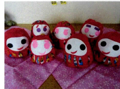
<だるまさん> 2歳児クラスの手作りだるまさん。表情がとっても素敵!よくみると作った本人になんとなく似ているなあ~