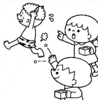
<大豆のおはなし> 豆まきで使う「大豆」には、たくさんの栄養が含まれているため「畑の肉」とも呼ばれています。園の給食でも色々な調理法で提供されています。ぜひ参考にしてみてください。

<節分> 節分の豆まきには、悪い物や災いにたとえた「鬼」を豆をまくことで追い払い一年の無病息災を願うという意味があるそうです。園では、3日に豆まきを行います。新聞を丸めた豆に見立てた物を投げます。子ども達はどんな「鬼」を退治するのでしょうか? 「コロナ鬼」を退治できるといいですね。