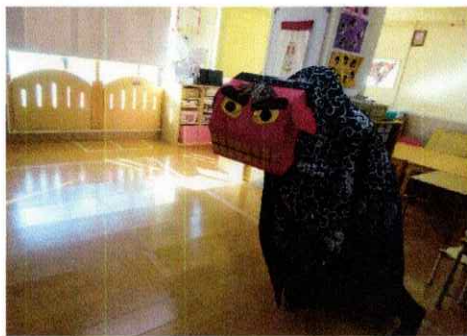
新年おたのしみ会に登場した獅子舞い